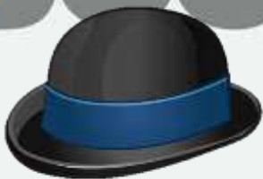
'n dophoed van Bolivia