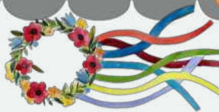
'n Oekraïense blomkroon genoem 'n vinok (vee-nok)