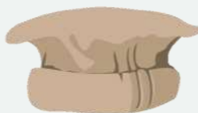
'n Dhaka Topi- hoed van Nepal