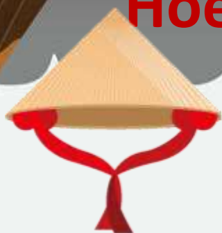
'n Viëtnamese non la strooihoed