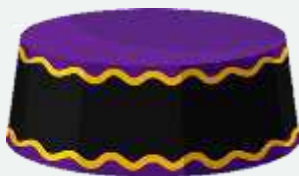
'n Kofia-hoed van Kenia