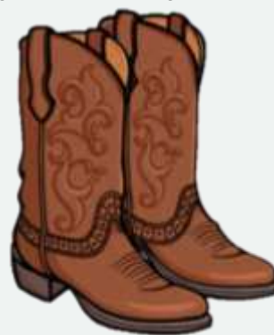
Amerikaanse cowboy stewels