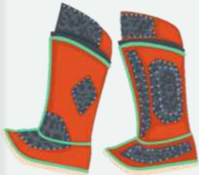
Mongoolse gutal (gu-lang) stewels