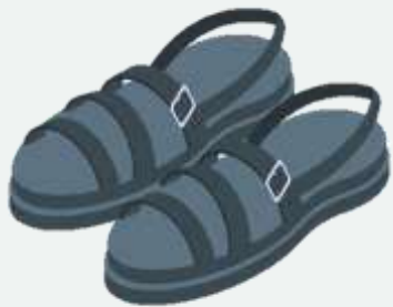
Peruaanse hojotas (oh-to-ta), gemaak van herwinde bande