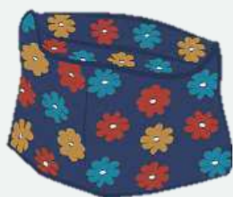
'n Dhaka Topi- hoed van Nepal