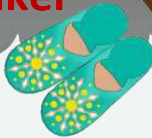
Marokkaanse babouche (bab-ooch) skoene