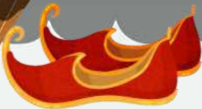
Indiese jutti (joo- tee) skoene