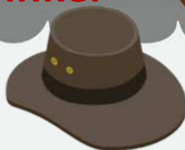
'n Boshod van Australië