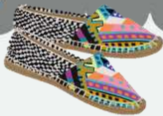
Spaanse espadrille (ess- pah-dree-yeh) sandale