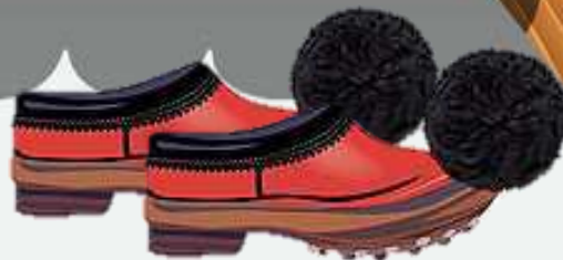
Griekse tsarouhi (sar-oo-hi) skoene