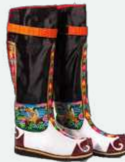
Tshoglam (show-lam) stewels van Bhoetan