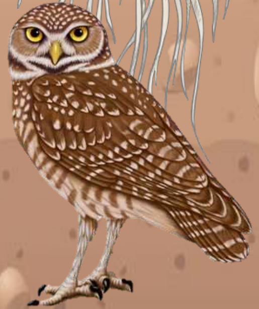
Florida se Grawende uil